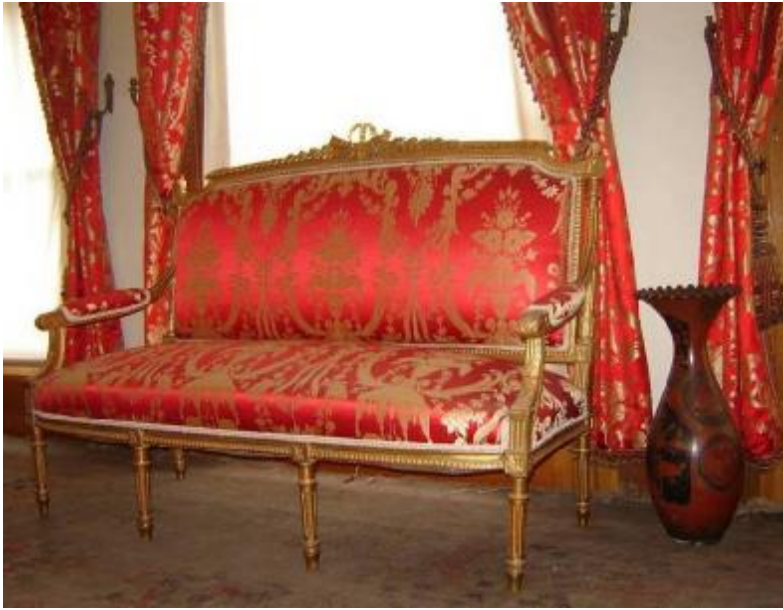
Resim 32: Dolmabahçe Sarayı Atatürk'ün Çalışma Odası