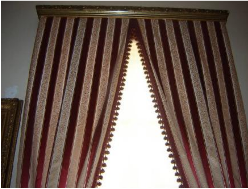
Resim 11: Dolmabahçe Sarayı 84 Numaralı Oda