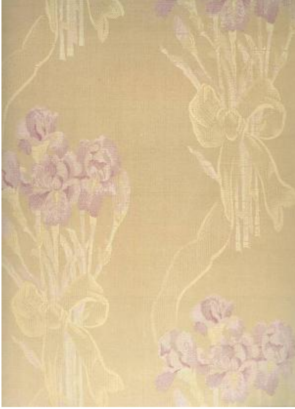
Desen 31: 864 No' lu Desen