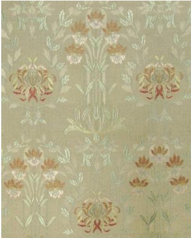
Desen 30: 847 No' lu Desen