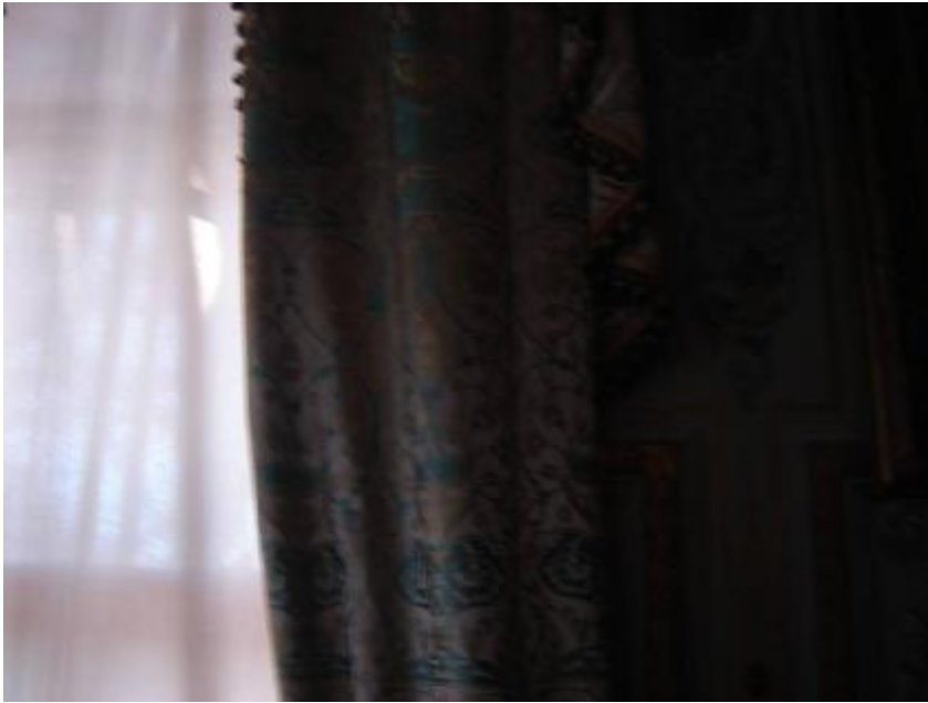
Resim 19: Dolmabahçe Sarayı Beyaz Oda