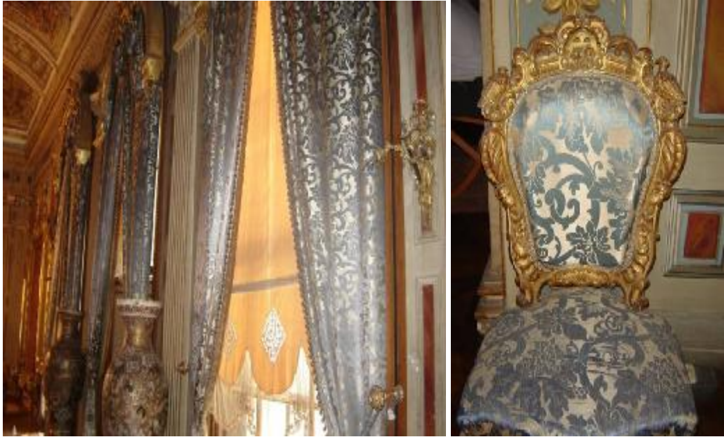
Resim 30, Resim 31: Dolmabahçe Sarayı Mavi Salon