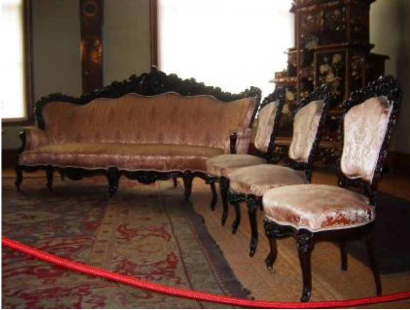
Resim 29:Dolmabahçe Sarayı 189 Numaralı Salon