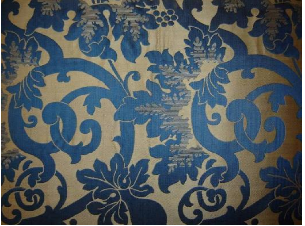
Desen 26: 70 No' lu Desen