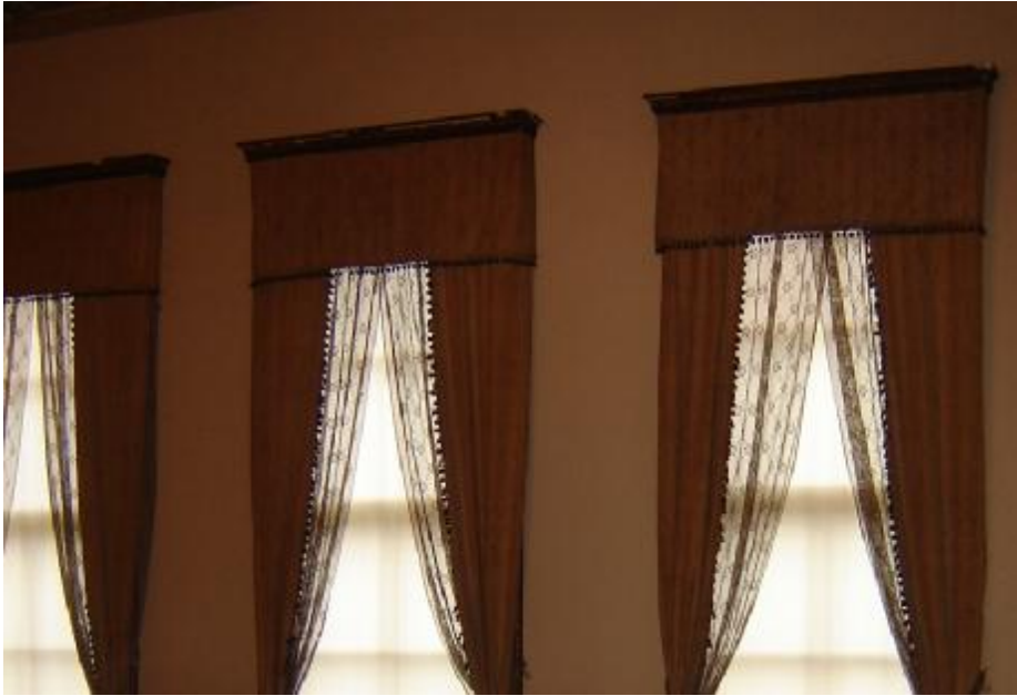
Resim 22: Dolmabahçe Sarayı 91 Numaralı Oda