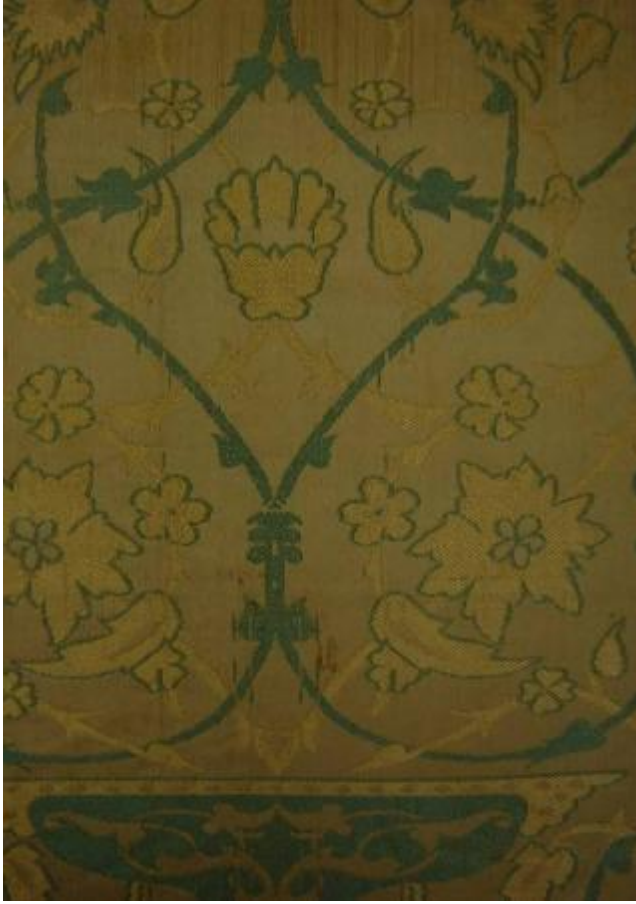
Desen 14: 76 No' lu Desen