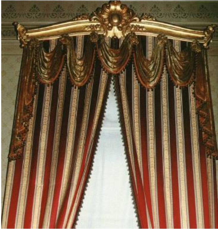
Resim 9: Dolmabahçe Sarayı 5 Numaralı Oda