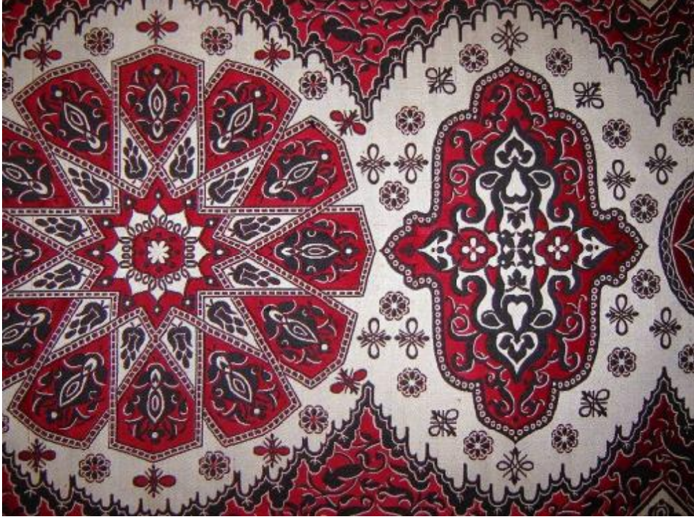
Desen 18: 308 No' lu Desen