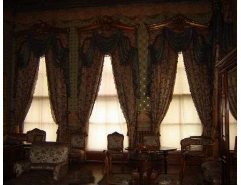
Resim 33, 34: Atatürk'ün vefat ettiği oda