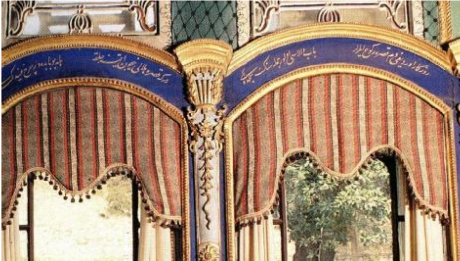
Resim 13: Aynalıkavak Kasrı Divanhane penceresi