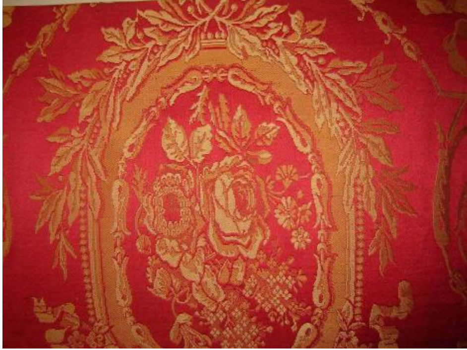
Desen 36: 98 No' lu Desen