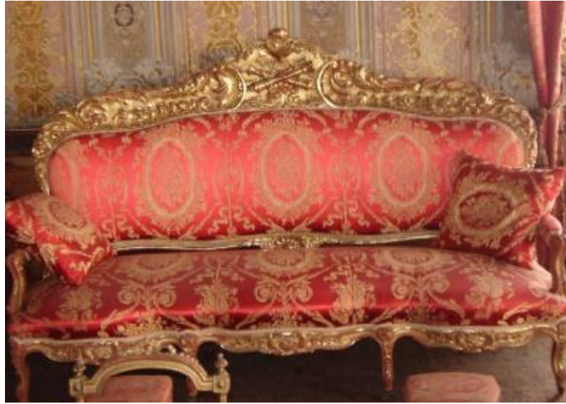
Resim 40: Dolmabahçe Sarayı Elçi Kabul Odası