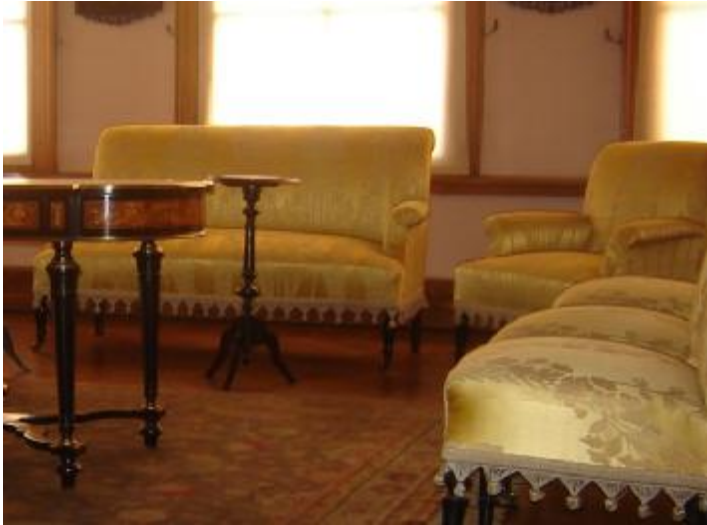
Resim 38: Dolmabahçe Sarayı 49 No' lu Oda