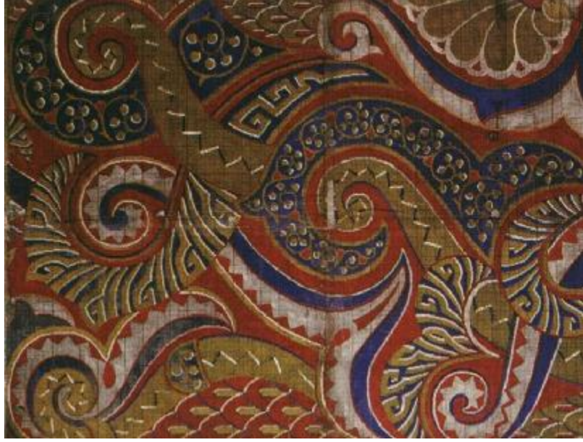
Desen 16: 89 Nolu Desen