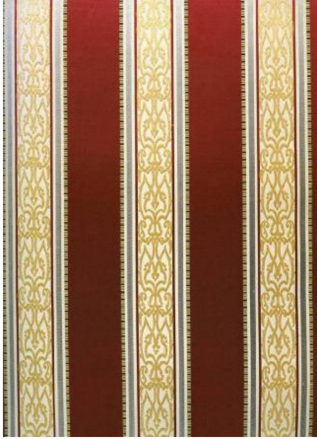
Desen 4: 207 No' lu Desen