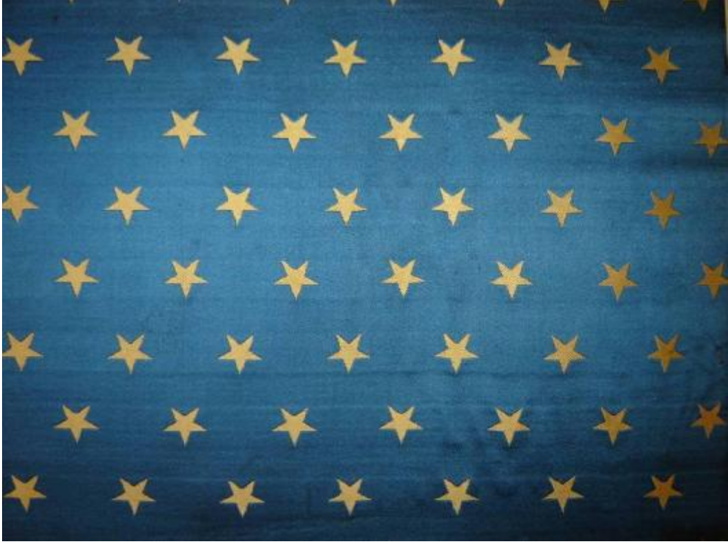
Desen 20: 371 No' lu Desen