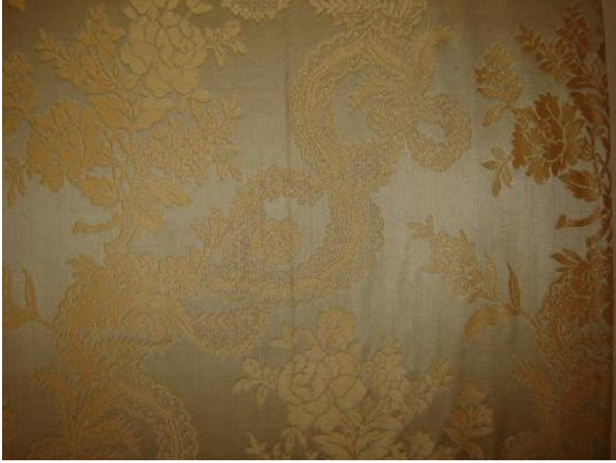
Desen 35: 999 No' lu Desen