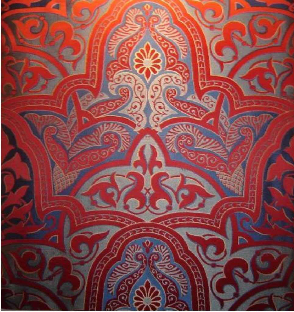
Desen 17: 114 No' lu Desen