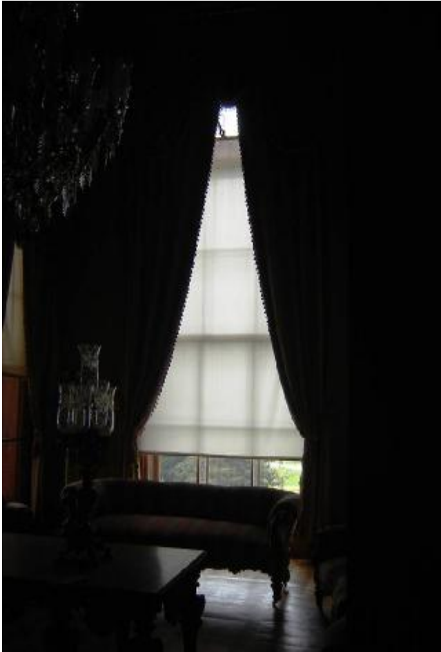
Resim 12: Dolmabahçe Sarayı Tercüman Odası