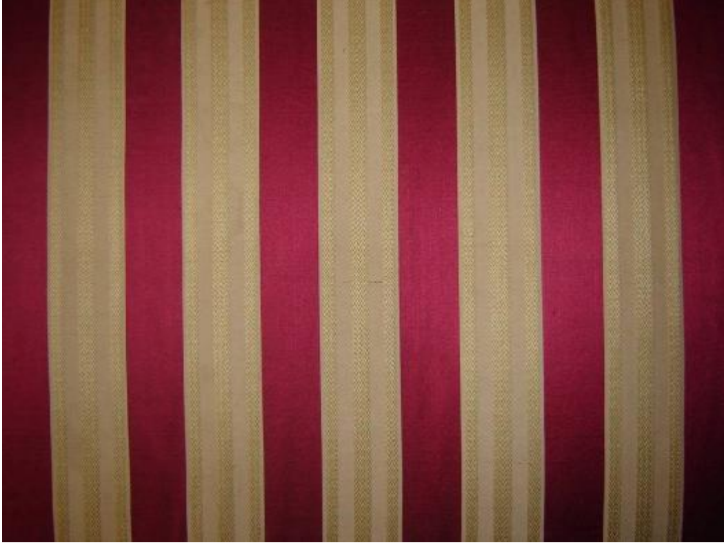
Desen 12:1007 No' lu Desen: