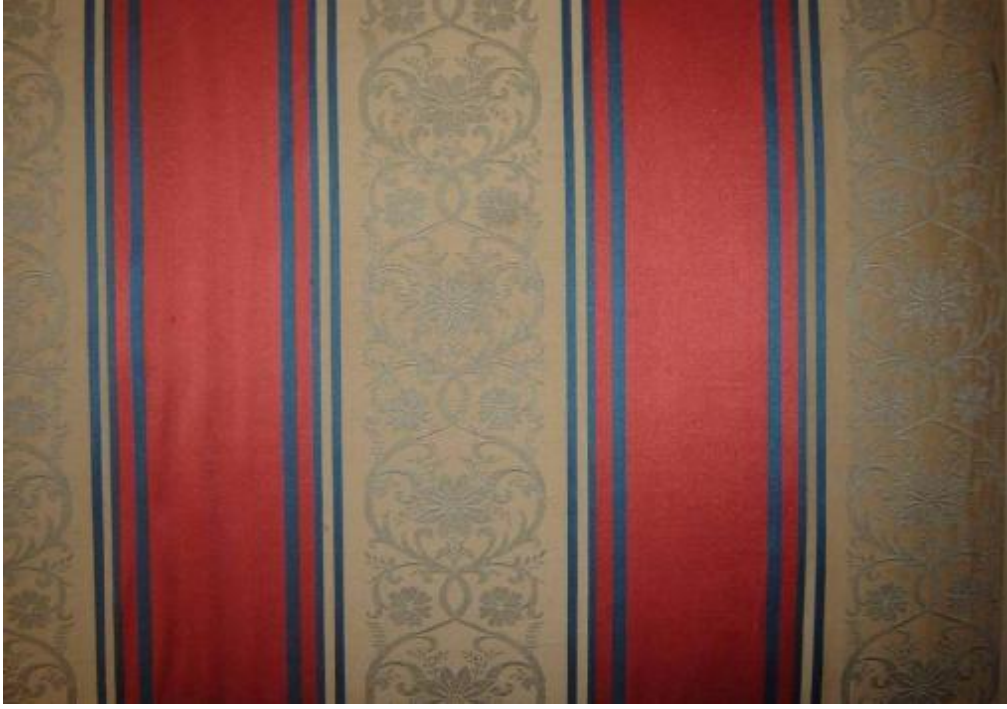
Desen 7: 302 Numaralı Desen