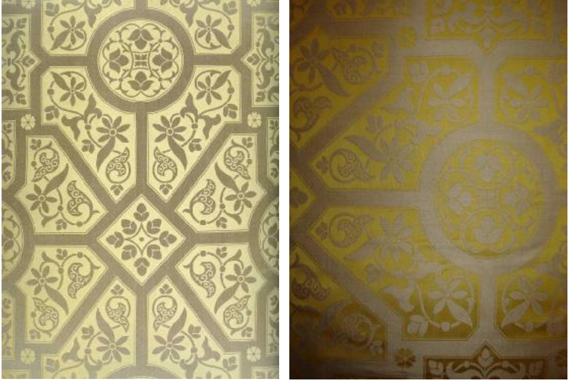
Desen 24: 42 No' lu Desen