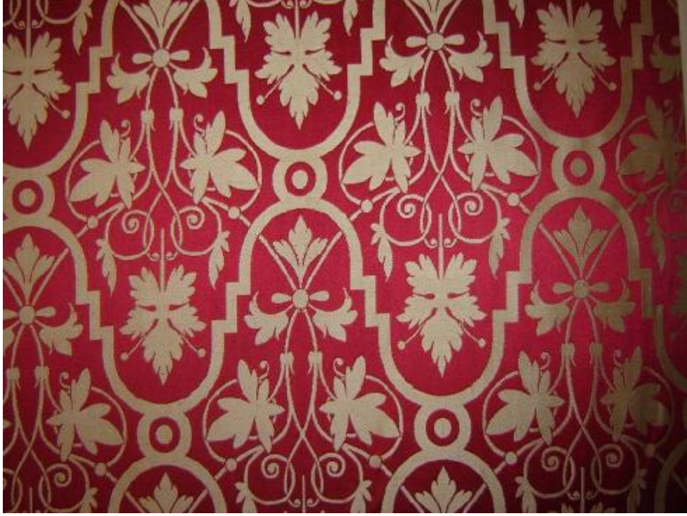
Desen 23: 36 No' lu Desen