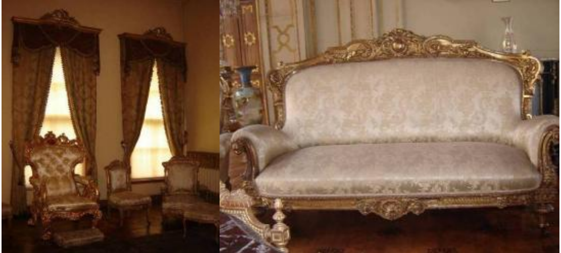
Resim 39: Dolmabahçe Sarayı Yatak Odası