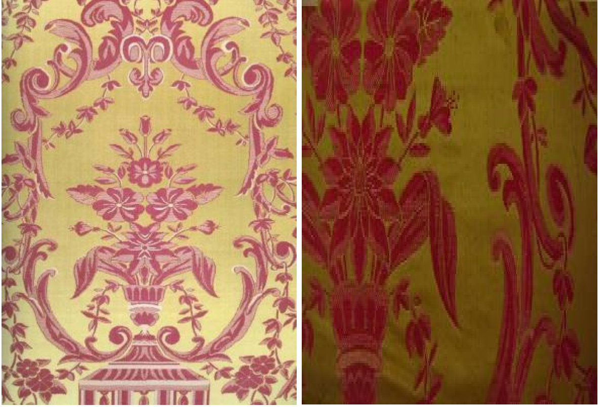
Desen 27: 78 No' lu Desen