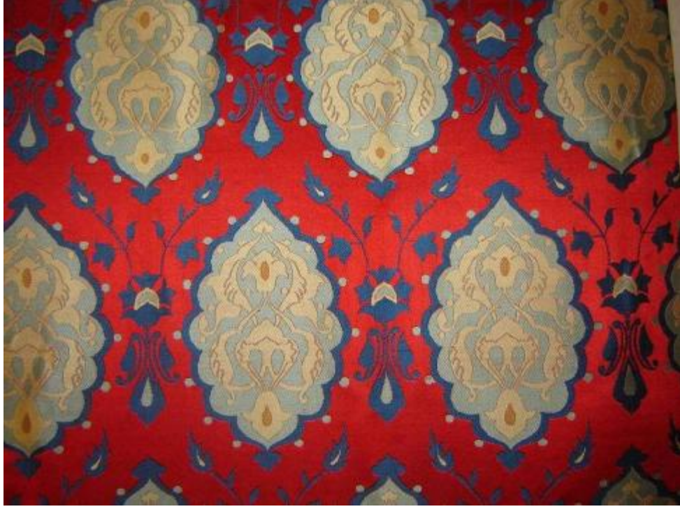
Desen 22: 1023 No' lu Desen