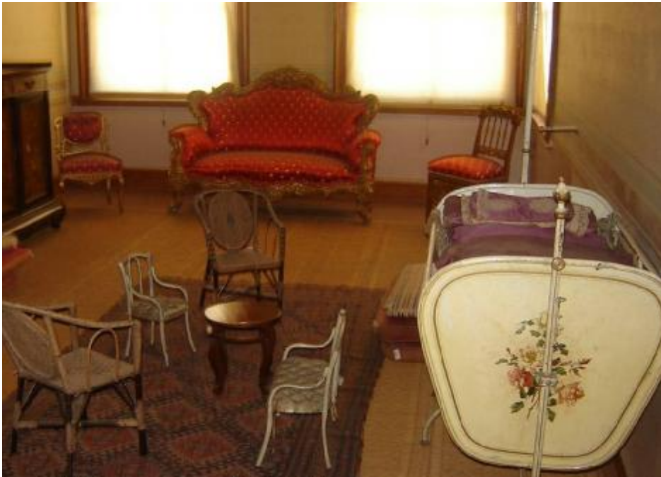
Resim 24: Dolmabahçe Sarayı 170 nolu Oda