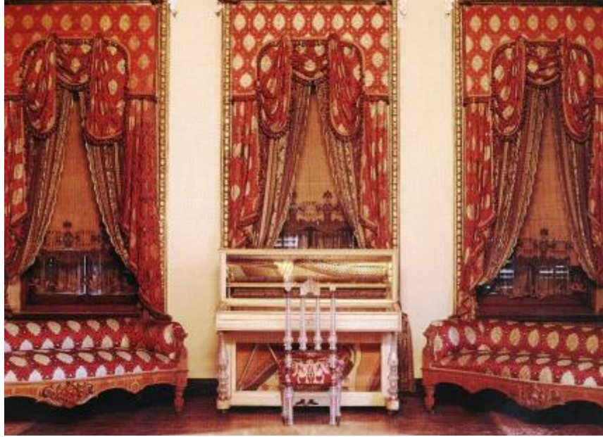
Resim 26: Dolmabahçe Sarayı 52 Numaralı Oda