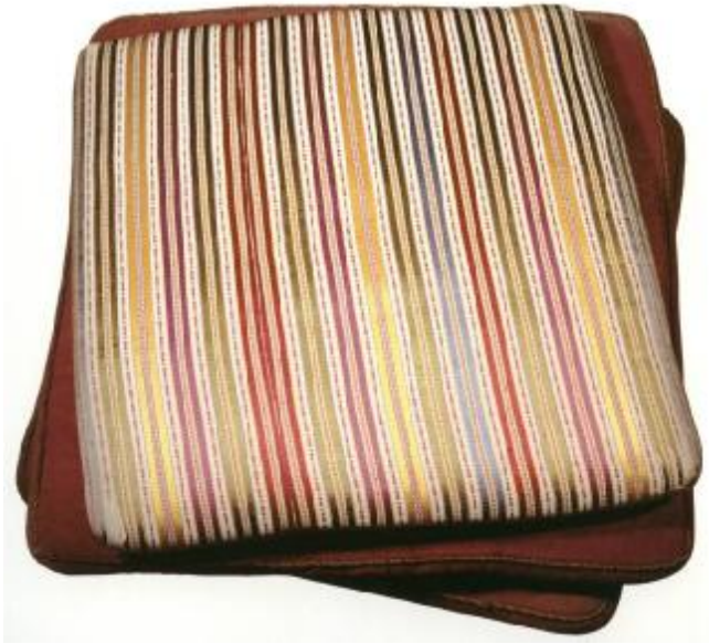
Resim 10: Dolmabahçe Sarayı 170 No' lu Oda