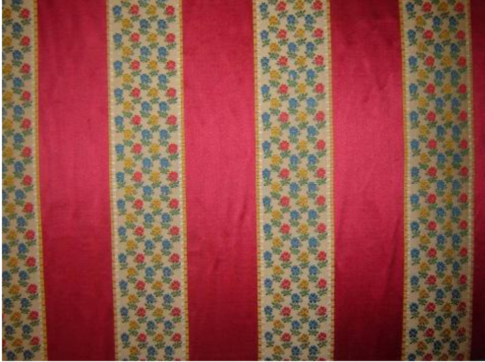
Desen 10: 1000 No' lu Desen