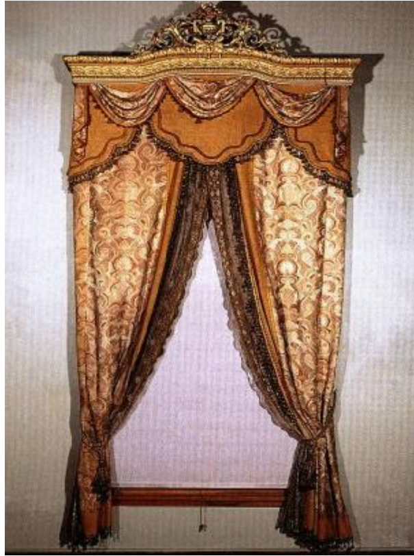
Resim 21: Dolmabahçe Sarayı 66 Numaralı Oda (Milli Saraylar Koleksiyonu)