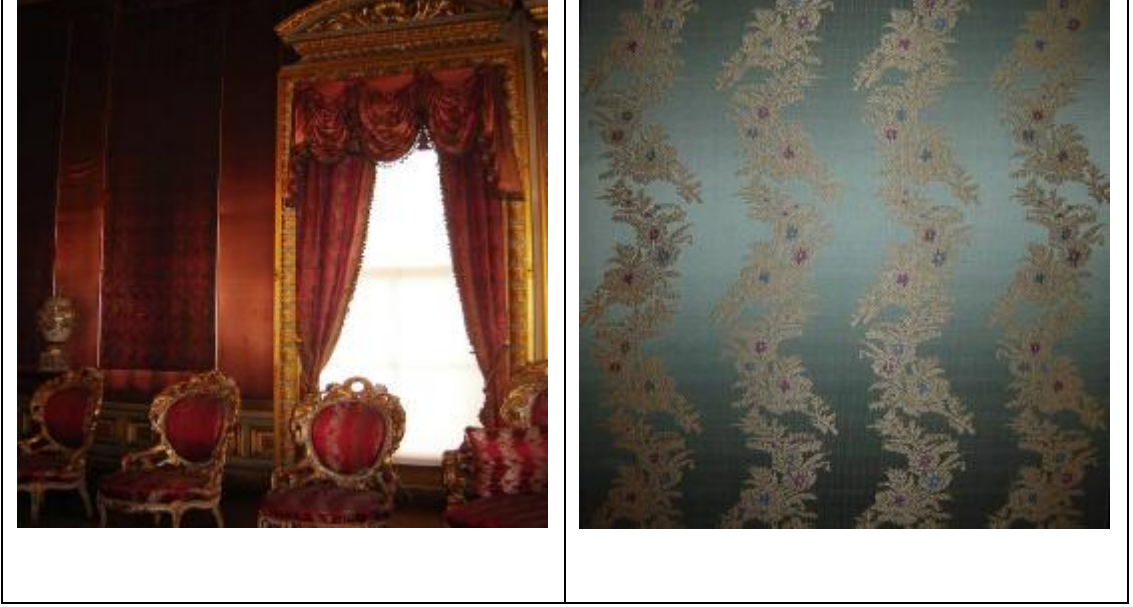
Resim 5: Dolmabahçe Sarayı Valide Sultan Kabul Odası

Sarayı'nda 62 numaralı odada mobilya ve perdesinde kullanılan kumaş duvar kaplaması olarak 1025 numaralı kumaşla kaplanmıştır. Bu kumaş duvar kaplaması günümüzde de ilk günkü orijinal haliyle bulunmaktadır. Bu kumaşta gümüş klaptanlar kullanılmıştır.