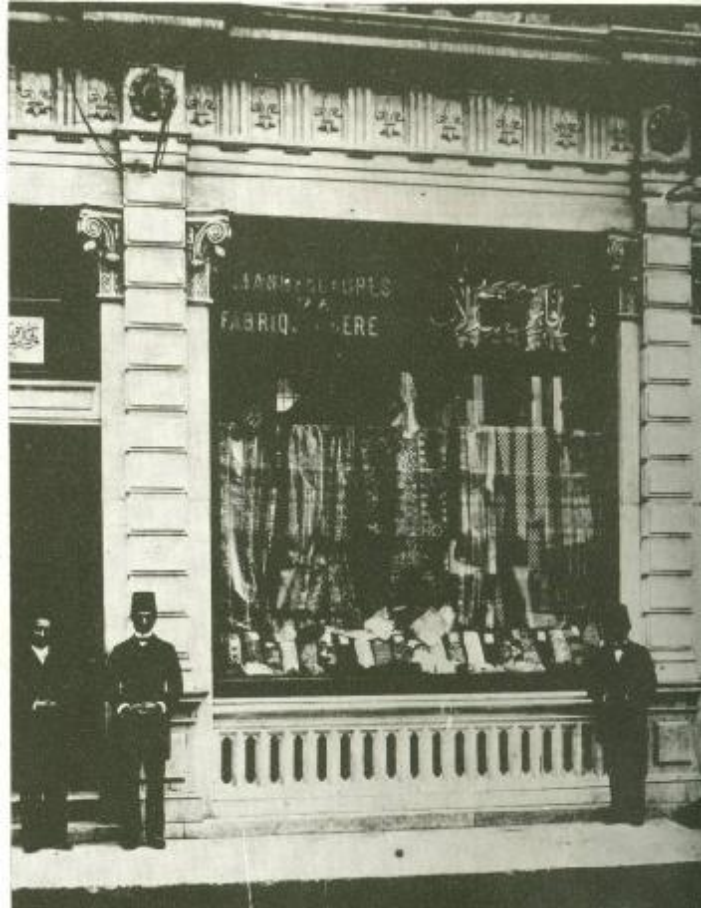
Resim 1 Taksim'de Açılan Mağaza

Sultan Abdülmecid' e devredildikten sonra, batılı anlayışla yapılmış saraylara ipekli canfes, döşemelik ve perdelikler üretmeye başlayan Hereke fabrikasına, 1850 yılında Kemhane bölümü de ilave edilerek büyütülmüştür. “İlk örnekleri Bursa ve Amasya'da görülen ve dolabi, gülistani, gülguni, Bursa kemhası, Eğin kemhası, marahuri gibi isimlerle bilinen Osmanlı kemhaları, Hereke Fabrika-i Hümayunu'nun da daha çok Batı etkisinde, iri dal ve çiçek motifleriyle dokunmuştur. Kemhane' nin kuruluşu sırasında, fabrikaya ayrıca Fransa'dan yüz ipekli tezgah getirildiği, önceden mevcut olan elli pamuklu tezgahın da İstanbul'a Zeytinburnu'nda bulunan başka bir fabrikaya gönderildiği bilinmektedir.” 30