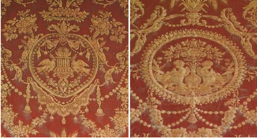
Desen 34: 952 No' lu Desen