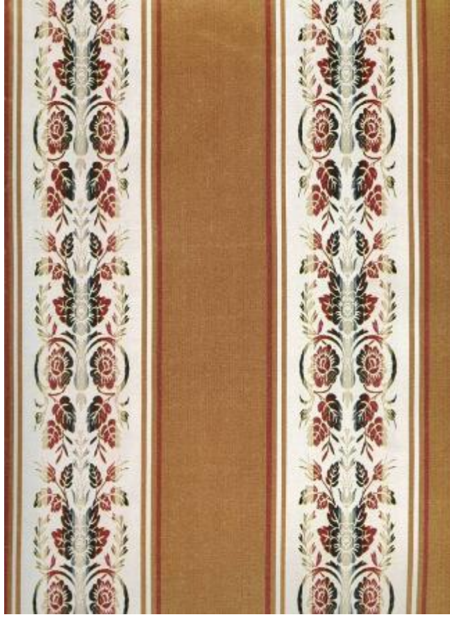
Desen 3: 103 Nolu Desen