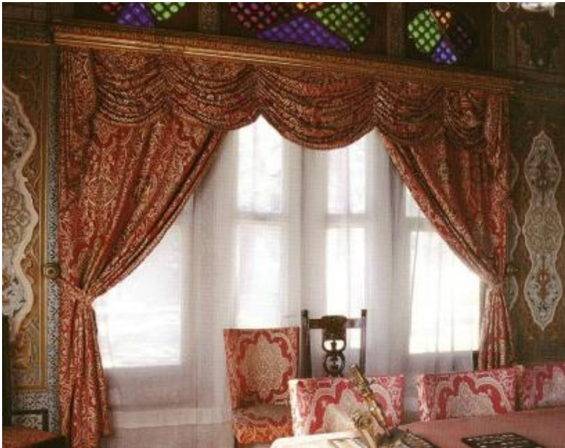
Resim 23: Hereke Kabul Salonu