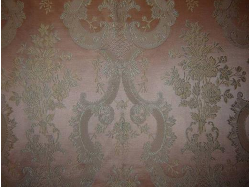
Desen 25: 57/ 911 No' lu Desen