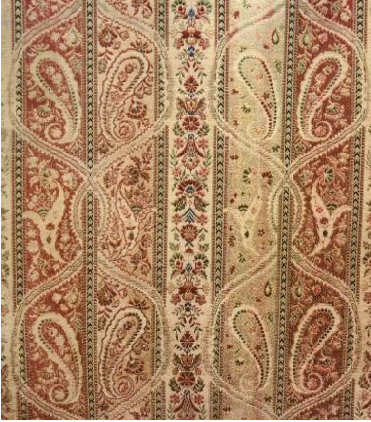
Desen 8: 703 No' lu Desen: