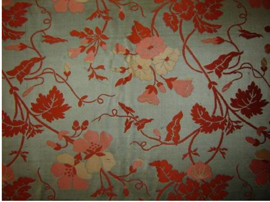
Desen 28: 90 No' lu Desen