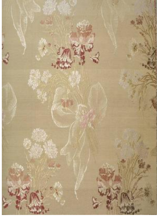
Desen 32: 870 No' lu desen