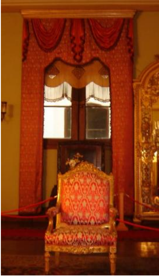
Resim 27: Dolmabahçe Sarayı Süfera Salonu