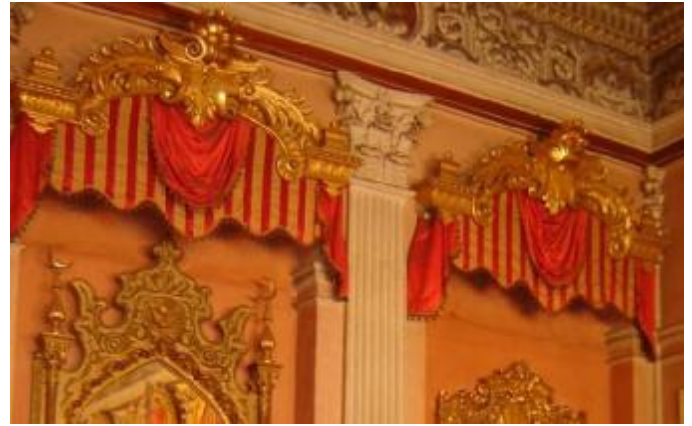
Resim 14: Dolmabahçe Sarayı Pembe Salon