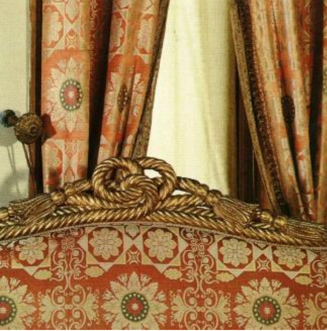
Resim 25: Beylerbeyi Sarayı Kaptan Paşa Odası