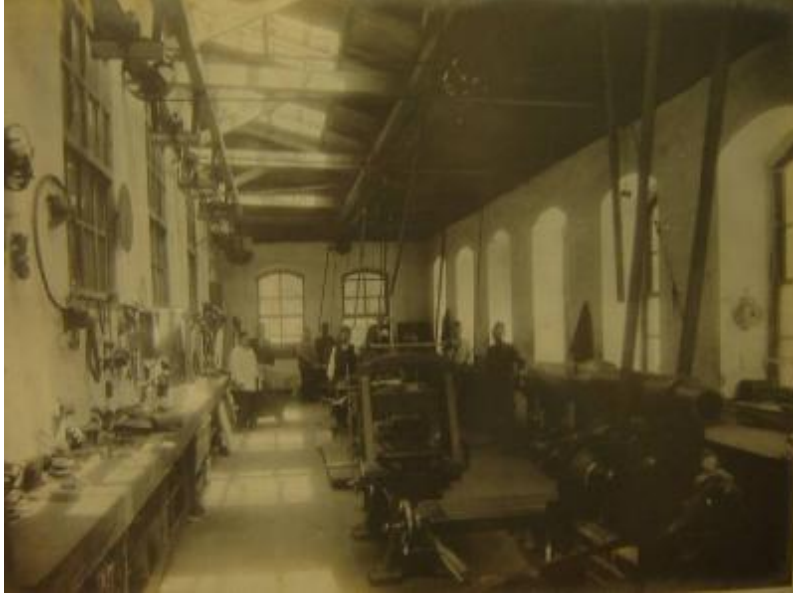
Resim 2: Hereke Fabrikasının Kuruluş Aşamasındaki Görünüş