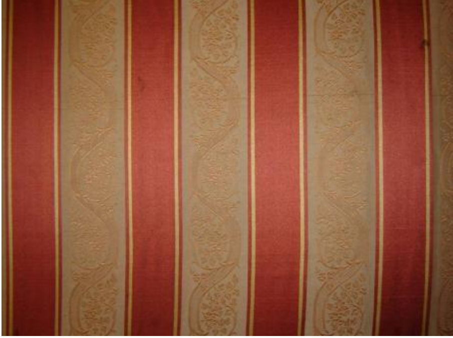
Desen 6: 301 Nolu Desen