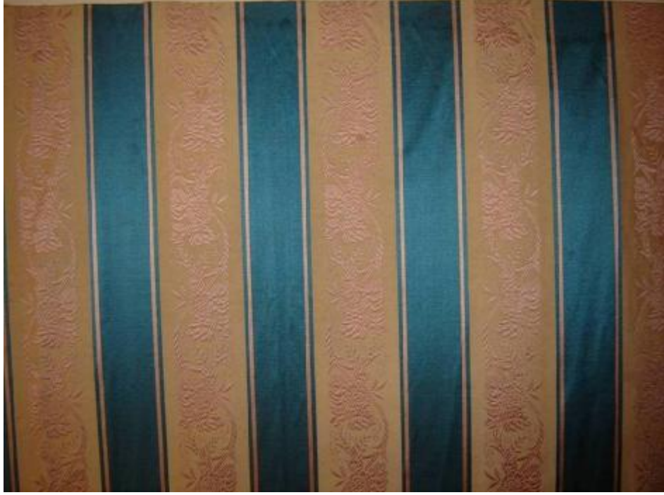
Desen 2: 100 numaralı desen