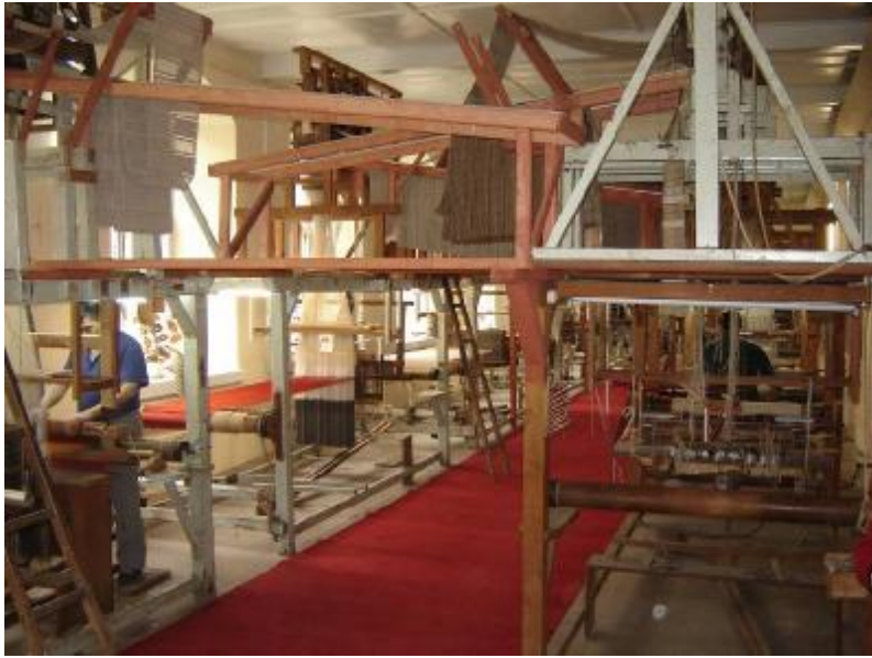
Resim 3: Hereke Fabrikasının Günümüzden Görünüm (2006)

Hereke Fabrikası Cumhuriyetin ilan edilene kadar saraylara ve saray hanedanına üretim yapmaya devam etmiştir. “Batılılaşma dönemi sarayları ile ilgili az sayıda kaynaktan biri olan Leyla Saz Hanım, Sultan Abdülaziz’in validesi Pertevniyal Valide Sultan tarafından kabul edildiği salonu şu sözlerle aktarmaktadır. Pertevniyal Valide Sultan Hazretlerini evvelce görmemiştim. Oda kapısından girerken içeri göz gezdirdim, Dolmabahçe Sarayı’nın orta kattaki odalarından denize bakan bir odaydı. Kalın perdelerin biraz loşlandırdığı odanın bir yan minderi ile, bir kanep, iki koltuk, birkaç sandalye, perdeleri, vişne rengi atlas üzerine çiçekli Hereke