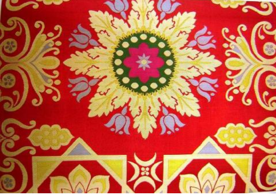
Desen 21: 379 No' lu Desen