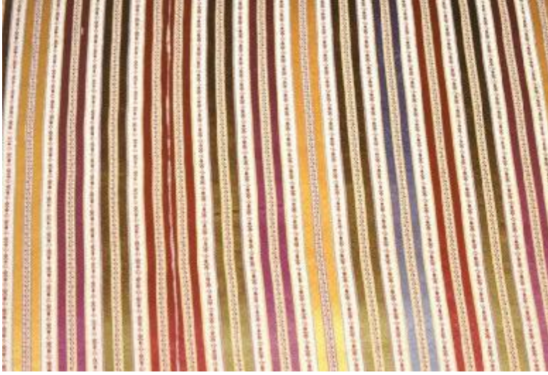
Desen 5: 250 Nolu Desen: