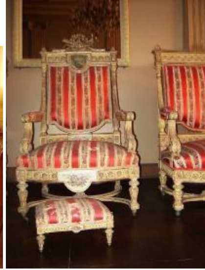
Resim 7: Selamlık Binek Salonu