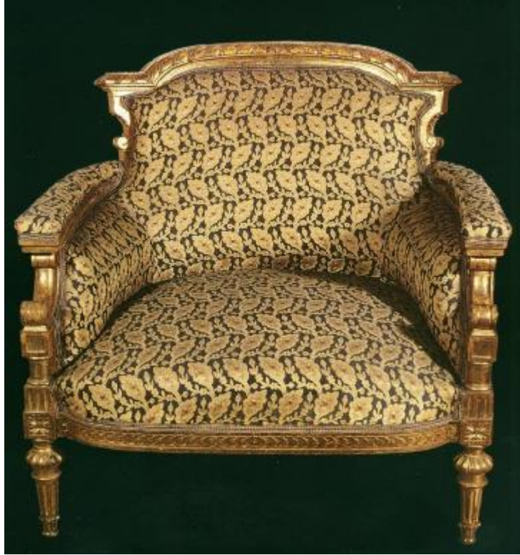
Resim 18: Dolmabahçe Sarayı 29 Numaralı Oda