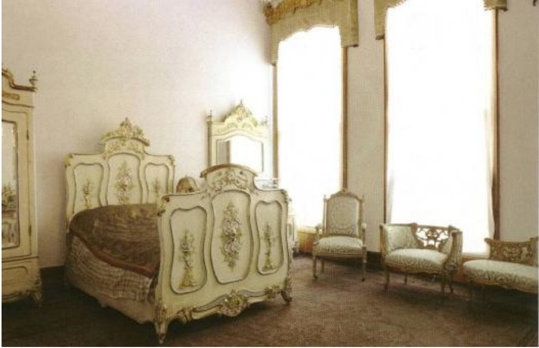
Resim 28: Dolmabahçe Sarayı Pertevniyal Valide Sultan Yatak Odası