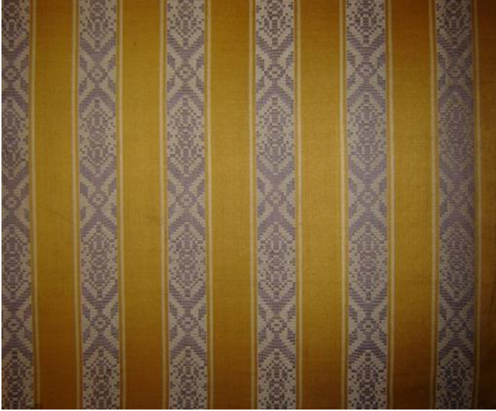
Desen 11: 1001 No' lu Desen: