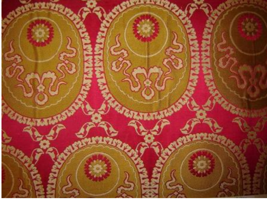
Desen 15: 81 Nolu Desen