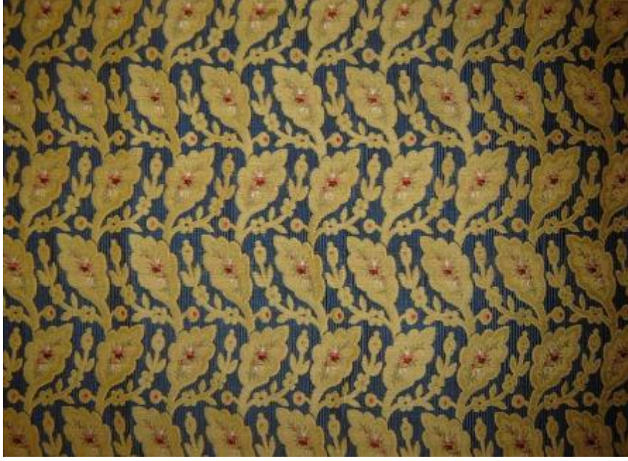
Desen 13: 1/A No' lu Desen