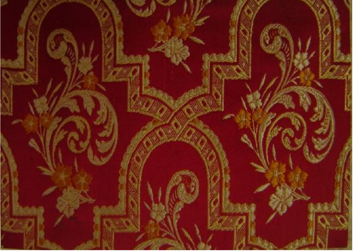
Desen 29: 145 No' lu Desen