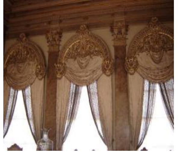
Resim 35, Resim 36: Dolmabahçe Sarayı Süfera Salonu