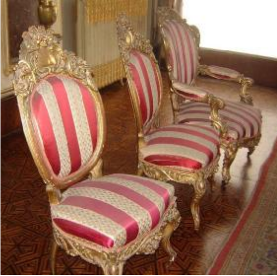
Resim 15: Dolmabahçe Sarayı Zülvecheyn Salonu