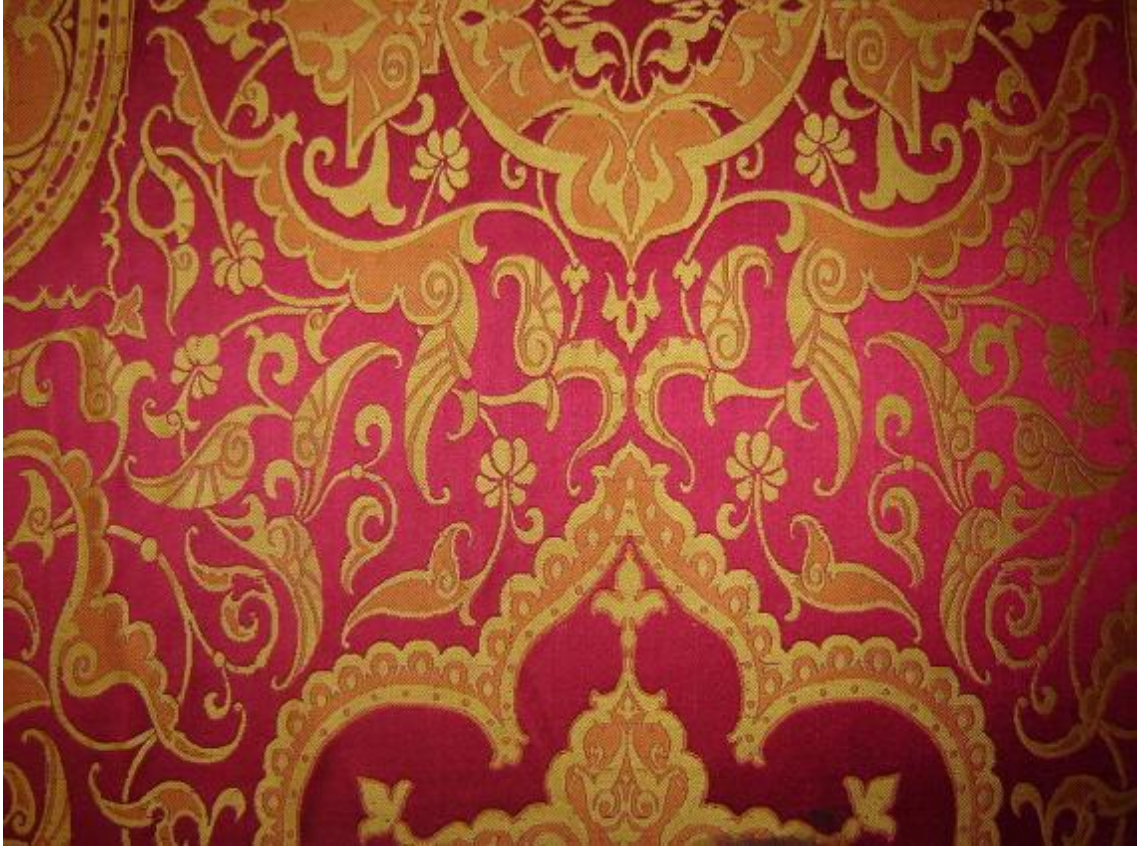
Desen 19: 356 No' lu Desen