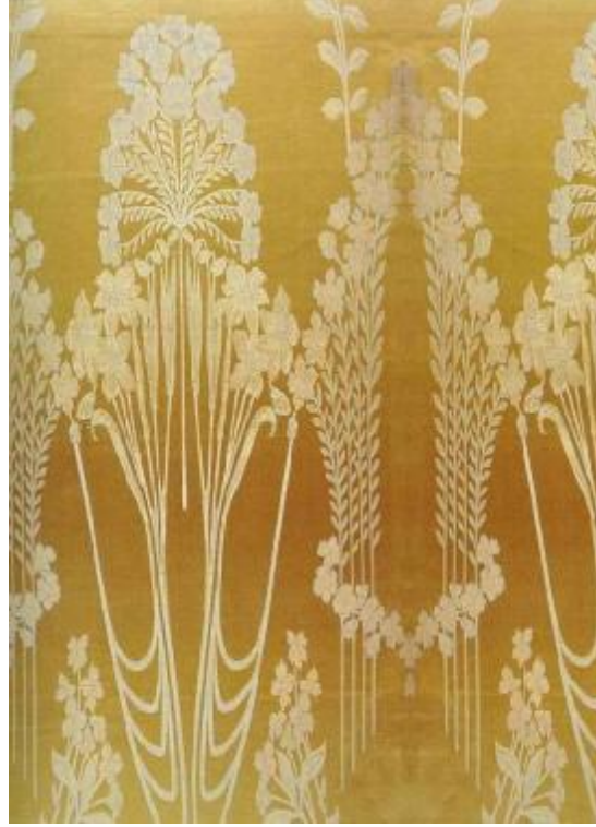
Desen 33: 924 No' lu Desen