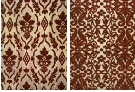
Resim 4: Hereke Dokumalarında Bulunan Çatma Kadifeler

Çatma kadifelerin desen tasarımlarında yoğunlukla bitkisel kaynaklı desenler görülmektedir. Genel olarak zemin rengi olarak krem, havının rengi olarak da koyu yeşil, bordo, bej renkleri kullanılmıştır. Ayrıca saltanat döneminde Kapalıçarşı ve Zaptiye Caddesinde açılan mağazalarda fabrikada yastık yüzü olarak üretilen çatma kadifeler, bugün özel koleksiyonlarda yer almaktadır.