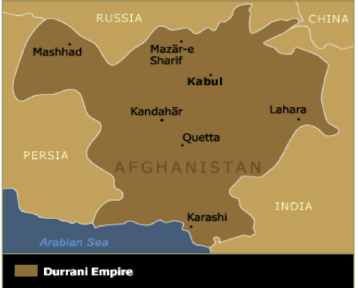
Harita 1: Durrani İmparatorluğu

( http://upload.wikimedia.org/wikipedia/ps/8/8f/Durani_empire-map1.gif , 12.05.2015)