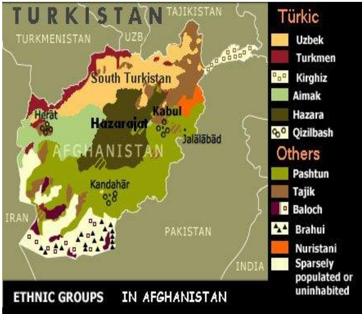
Harita 5: Afganistan Etnik Haritası

( https://guneyturkistan.wordpress.com/category/arastirma/page/2/ , 15.05.2015)