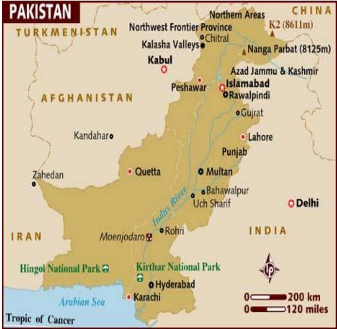
Harita 6: Pakistan Haritası

( http://www.orsam.org.tr/tr/trUploads/Haritalar/Images/1-fiziki.jpg , 15.05.2015)