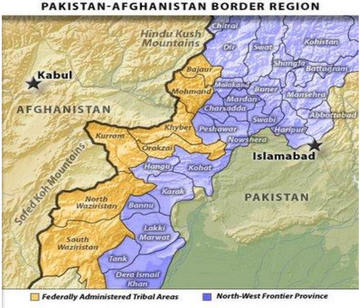
Harita 2: Afganistan-Pakistan sınırı: Durand Sınır Hattı ve Kabail bölgesi

( http://www.orsam.org.tr/tr/trUploads/Haritalar/Images/2-co%C4%9Frafı.JPG , 12.05.2015)