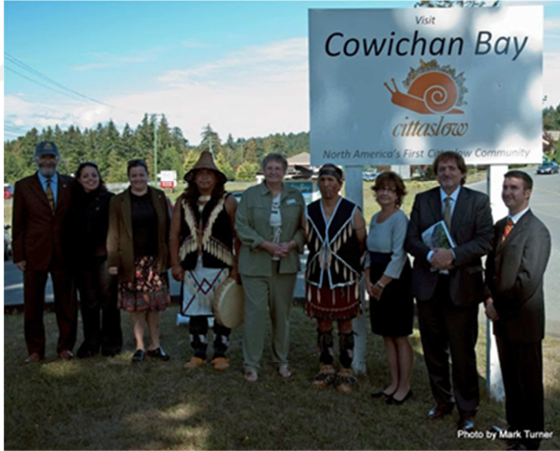
Resim 5: Cittaslow Cowichan Bay