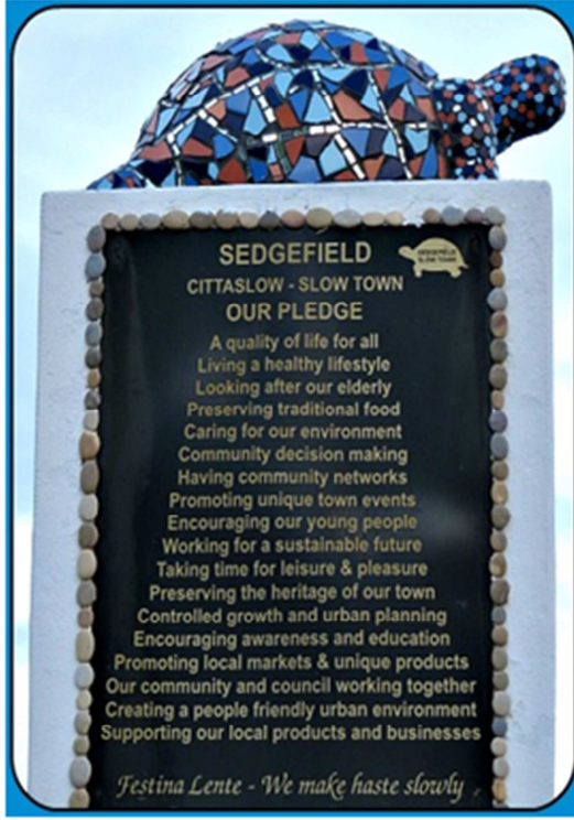
Resim 9: Sedgfield- Citaslow Anıtı

SEDFIELD CITTASLOW-SAKİN KENT YEMİNİMİZ Herkes için kaliteli bir yaşam Sağlıklı bir yaşam tarzında yaşamak Yaşlılarımıza bakmak Yöresel yemeklerimizi korumak Çevremizi önemsemek Halk meclisleri oluşturmak Toplumsal ağlar oluşturmak Yerel organizasyonları teşvik etmek Genç nesli desteklemek Sürdürülebilir bir gelecek için çalışmak Eğlence ve zevk için zaman ayırmak Kasabamızın mirasını korumak Kent planı oluşturmak ve kontrollü gelişmek Eğitimi ve bilinçlenmeyi desteklemek Yerel ürünleri ve pazarları desteklemek Halk ve yönetim olarak birlikte çalışmak Çevre dostu insanlar olmak Yerel üretimi ve yerel ürünleri desteklemek Yavaşça Acele et- Yavaşça acele