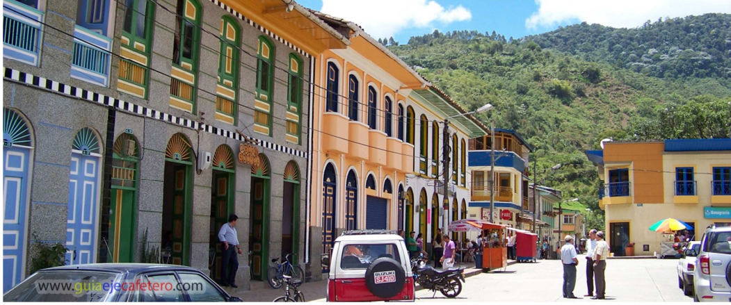
Resim 10: Pijao