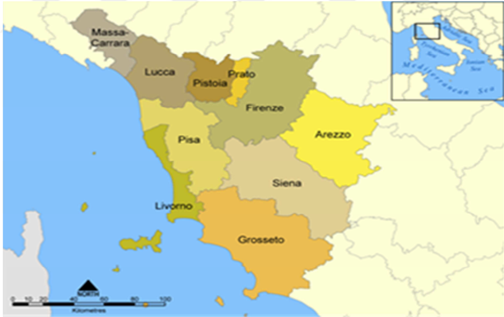
Resim 1: Toskana Bölgesi Haritası