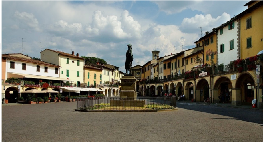
Resim 2: Greve in Chianti