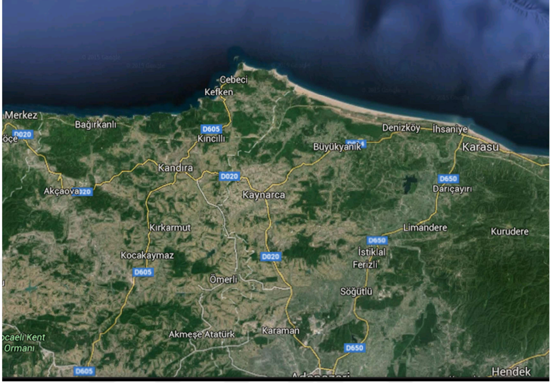
Resim 13: Kandıra Haritası