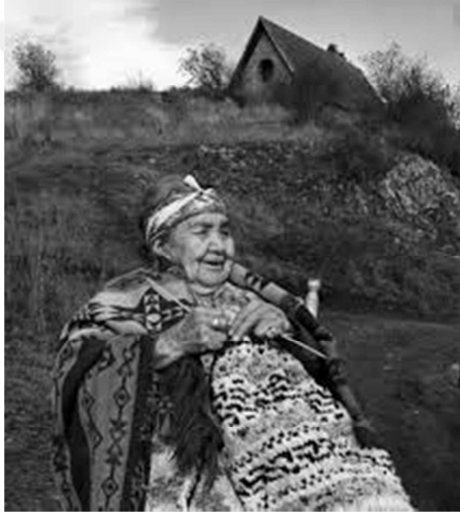
Resim 6: Cowichan Yerlisi