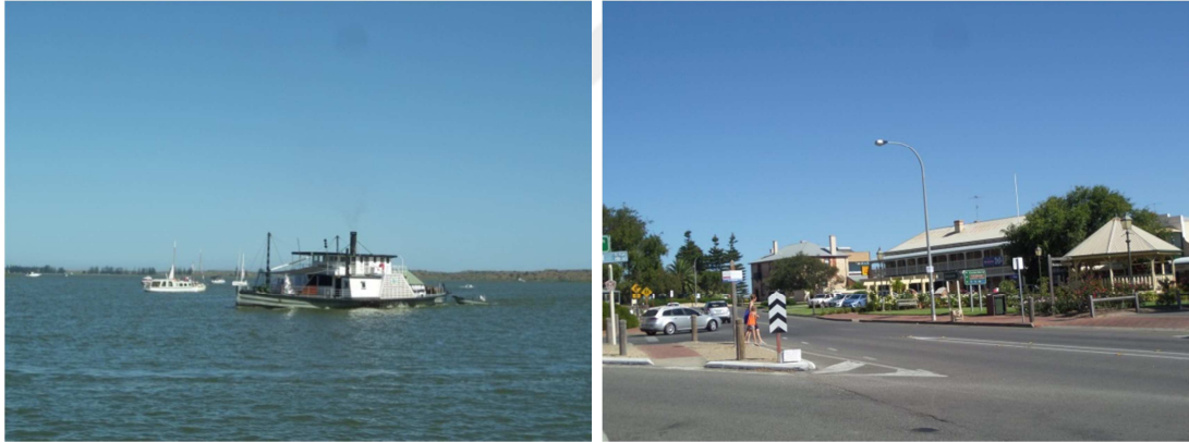
Resim 3: Goolwa

Kaynak: Hande Akman, 20 Mart 2015, Goolwa Avustralya