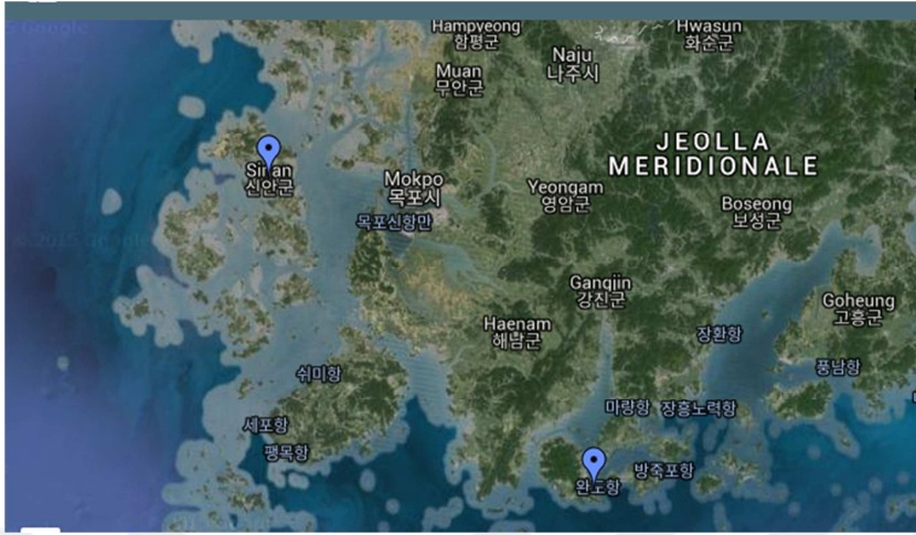
Resim 4: Shinan - Güney Kore Haritası