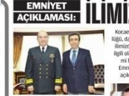
DONANMA'DAN GÖZALTİ Darbe girişimi, Donanma'dan gözalti. Darbe girişimi, Donanma'dan gözalti.