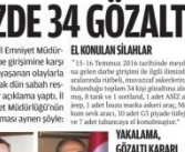
EL KODLANAN SİLÂHLAR Darbe girişimi, el kodlanan silâhlar. Darbe girişimi, el kodlanan silâhlar.