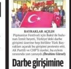
YAKALAMA GÖZALTİ KARARI Darbe girişimi, yakalama gözalti kararı. Darbe girişimi, yakalama gözalti kararı.