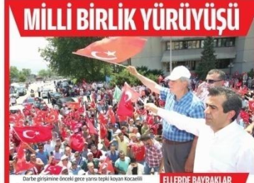
MILLİ BİRLİK YÜRÜYÜŞÜ Darbe girişimi, Milli Birlik Yürüyüşü ile karşılandı. Milli Birlik Yürüyüşü ile karşılandı.