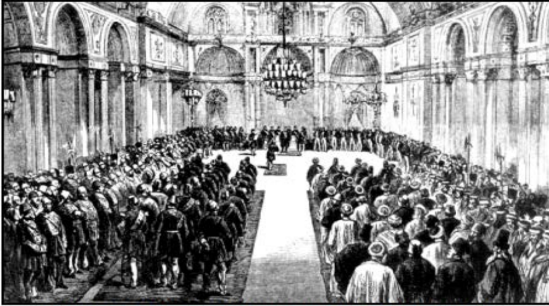
Resim 2.4: Meclis-i Umuminin Açılışı (19 Mart 1877) 30