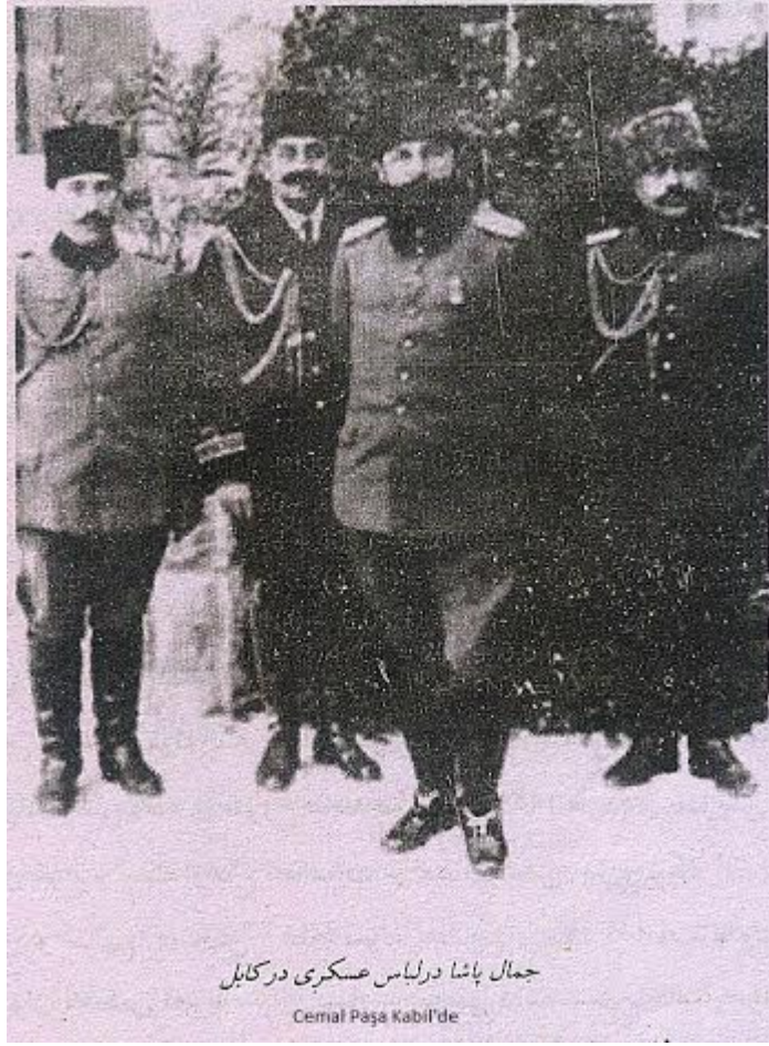
(Pamir, 2012: 148)