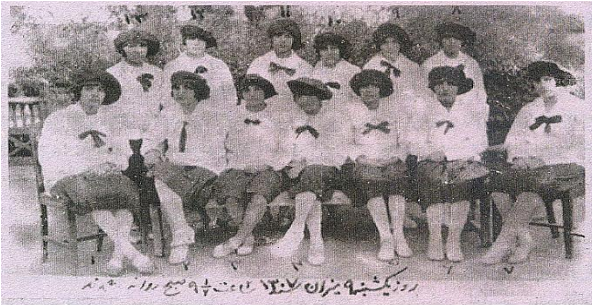
1307'de Amanullah tarafından Türkiye'ye gönderilen kız öğrenciler