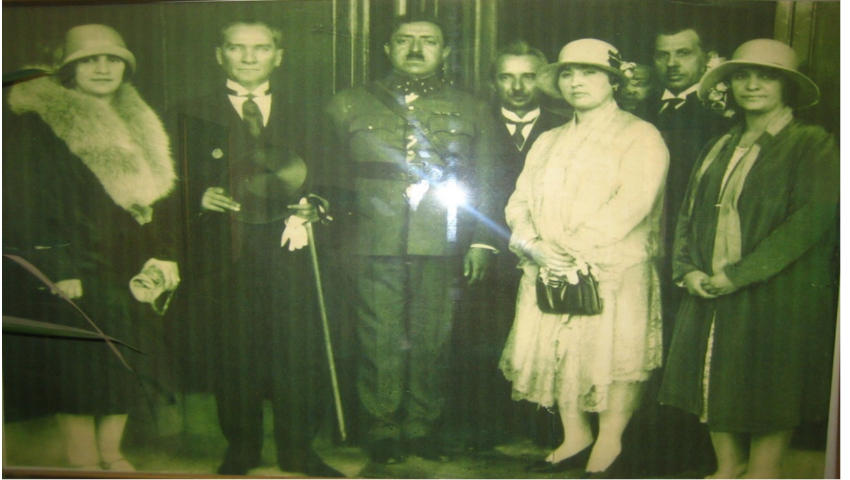
(Pamir, 2012: 105)