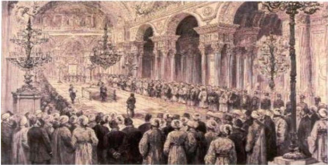
1876 Meclis-i Mebusan