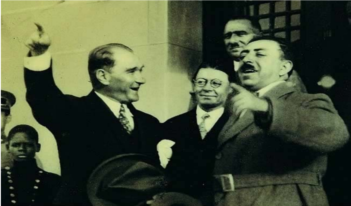
(Pamir, 2012: 105)