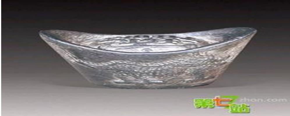
Ek 6: Qing Hanedanlığı Gümüş Parası: Yin Liang.