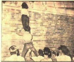
KACAKLAR - "Beatnik"ler New York'ta verdiği konser de baskınla tutuklandı. Yakararak, uzun süreli tutuklanma kilitlenmiş gitmek için davaya intizamın kati olarak bir grup geyikçiydi.

WASHINGTON, (A.A.P.) - Amerika Birleşik Devletleri Savunma Bakanlığı, Vietnam savaşında 20 Amerikan askerinin 830'sünün öldüğü açıklandı.