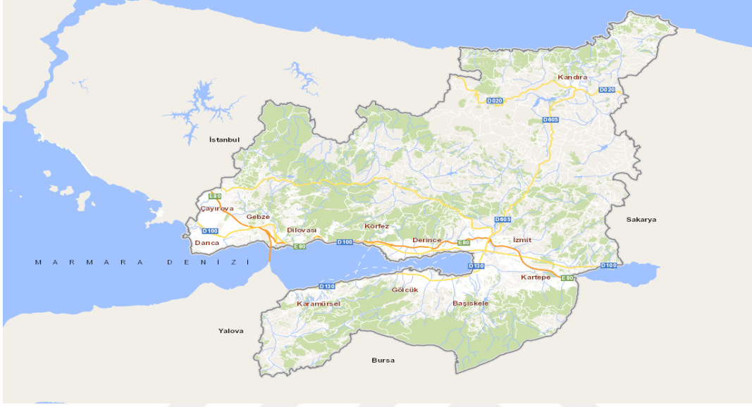
Çizim 1. Kocaeli ili haritası (www.rehber.kocaeli.bel.tr)

Kocaeli ili Marmara bölgesinin Çatalca-Kocaeli bölümünde 29°22'-30°21' doğu boylamı, 40°31'-41°13' kuzey enlemi arasında yer alır. Doğu ve güneydoğuda Sakarya ili,