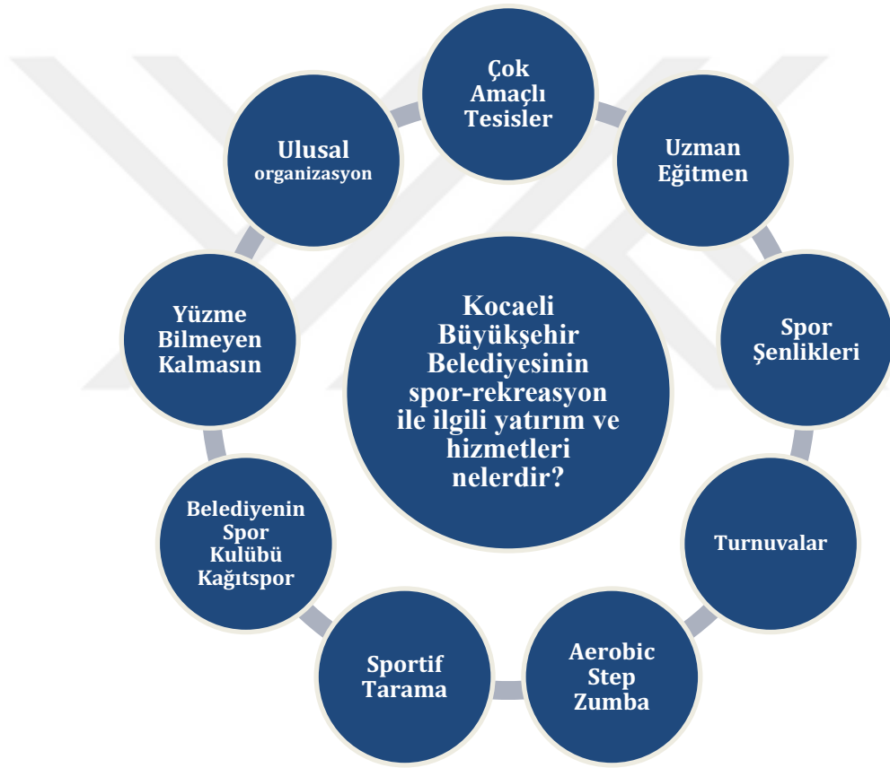
Çizim 4. 1. Kocaeli Büyükşehir Belediyesinin spor-rekreasyon ile ilgili yatırım ve hizmetleri nelerdir?

“...her geçen gün rağbet artıyor. Satranç ligine altı-yüz kişi katılıyor, altı-yüzün yanında birde annesi, babası, teyzesi, dedesi bekliyor. Kaliteli günde bir sürü aile görüyorum. Bunlar çok güzel tablolar, bu noktada büyükşehir hem fiziksel hem de sosyal olarak spora teşvik ediyor ve destekliyor.” (Ek.3)