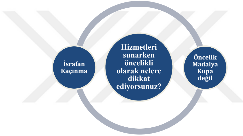
Çizim 4. 5. Hizmetleri sunarken öncelikli olarak nelere dikkat ediyorsunuz?

“Öncelikle israf etmemeye çalışıyoruz, iki herkese ulaşmaya çalışıyoruz ve başta da ifade ettiğim bir spor kültürü oluşturmaya çalışıyoruz. Bir madalya bir kupa almak değil derdimiz.