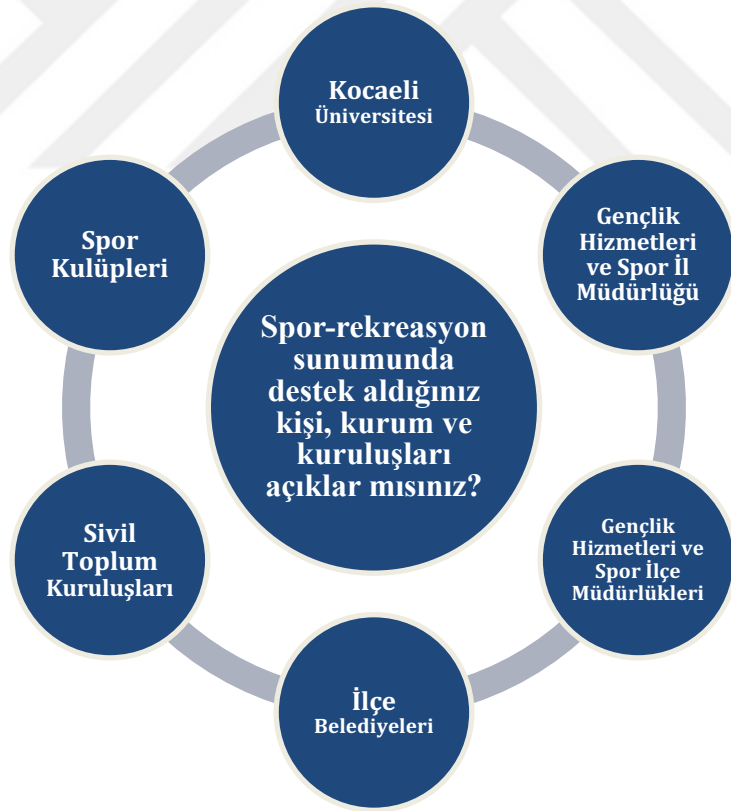
Çizim 4. 6. Spor-rekreasyon sunumunda destek aldığınız kişi, kurum ve kuruluşları açıklar mısınız?

“Tabii ki var. Kocaeli Üniversitesi Spor Bilimleri Fakültesi, Valilik bünyesindeki il gençlik Spor il müdürlüğü, İlçe gençlik Spor il müdürlükleri, Okul Sporları Spor müdürlüğü, İlçe belediyeleri, sivil toplum kuruluşları ve spor kulüpleriyle partnerlik ve istişareler yapıyoruz. Herkesin katılımını sağlamaya dikkat ediyoruz, birlik varsa daha çok başarı var ve daha etkili olur diye düşünüyoruz. Tabi burada eşgüdümün sağlamak da çok önemli yani bir enerji israfı kaynak israfı yapmamakta önemli o yüzden birlikte planlamaya gayret ediyoruz birlikte planlıyoruz. Başarıdaki en önemli etkenin bu paydaşları artırmak olduğunu görüyoruz.”