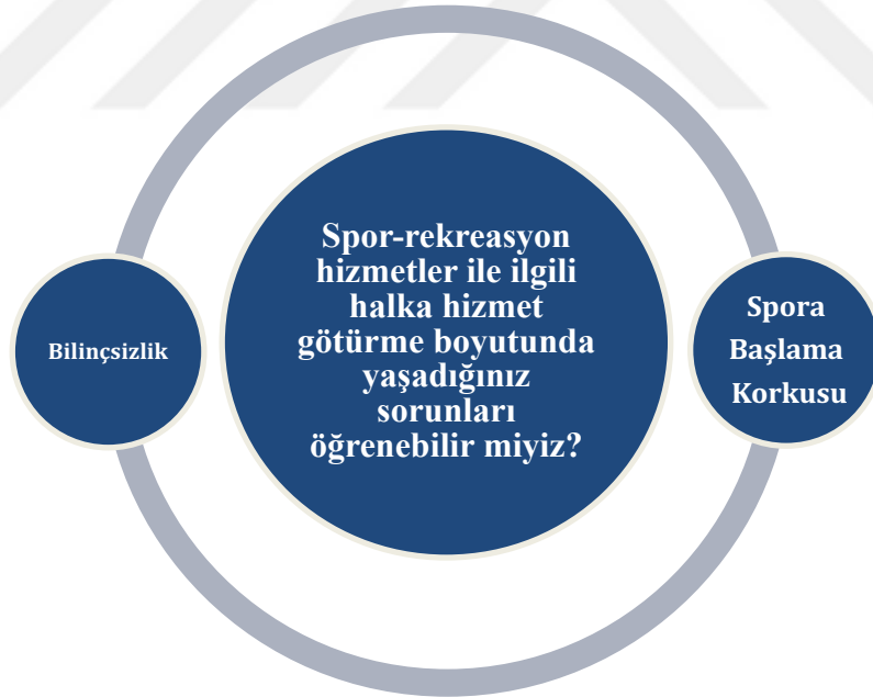
Çizim 4. 7. Spor-rekreasyon hizmetler ile ilgili halka hizmet götürme boyutunda yaşadığınız sorunları öğrenebilir miyiz?

“...belli bir yaştan itibaren biraz daha sağlık veya işte bireysel sporlar noktasında biraz daha özgüveni arttırıcı tercihler ortaya çıkıyor.”