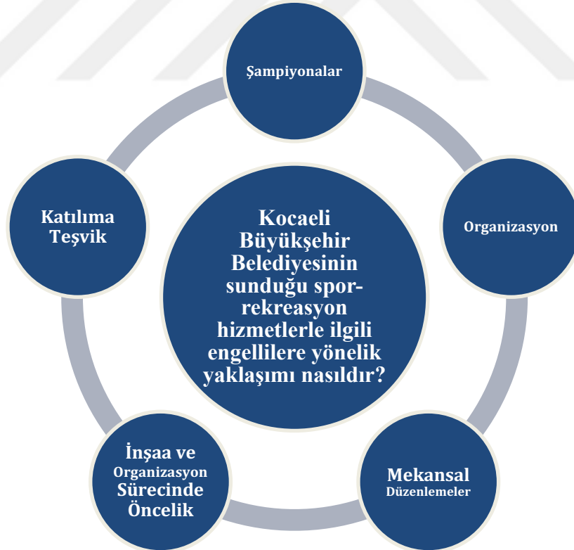
Çizim 4. 8. Kocaeli Büyükşehir Belediyesinin sunduğu spor-rekreasyon hizmetlerle ilgili engellilere yönelik yaklaşımı nasıldır?

“Ayrıca engelli kategorisinin de bulunduğu açık yüzme yarışları yaptık. Engelli sporcularımız 3 km yüzdü. Bu tür faaliyetler bizim hoşumuza gidiyor ve özellikle onların katılımı noktasında hassasiyet gösteriyoruz ve teşvik ediyoruz.” (Ek.3)