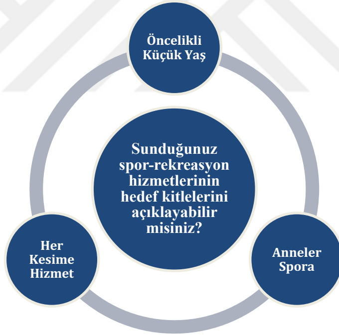
Çizim 4. 4. Sunduđunuz spor-rekreasyon hizmetlerinin hedef kitlelerini açıklayabilir misiniz?

“...spor felsefesini vermeye çalışıyoruz. Yani hedef kitle olarak herkese ulařmaya çalışıyoruz. Tabi amaçlar farklılařabilir.”